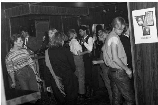
Fra Club Privé.