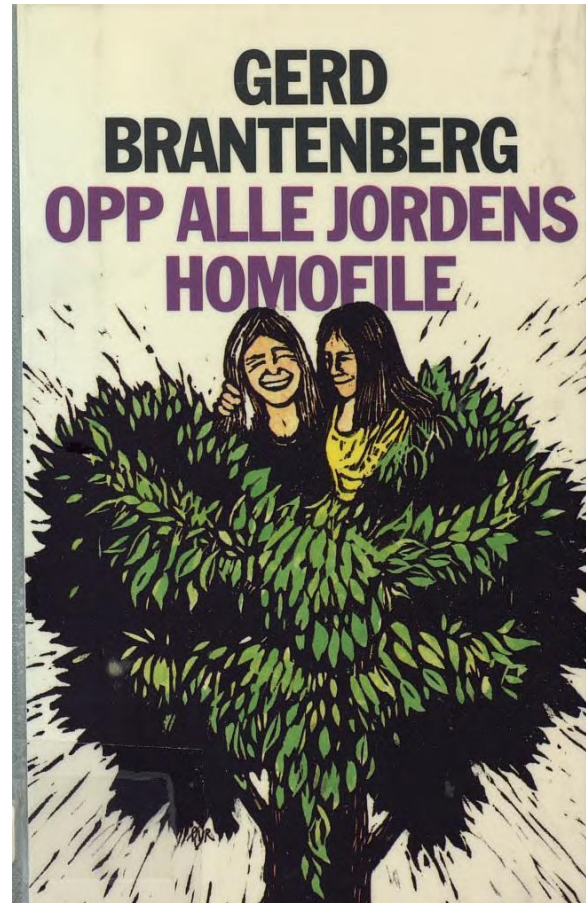
Tittelbladet til Vi som føler annerledes . Omslaget til 2. opplag av Opp alle jordens homofile .